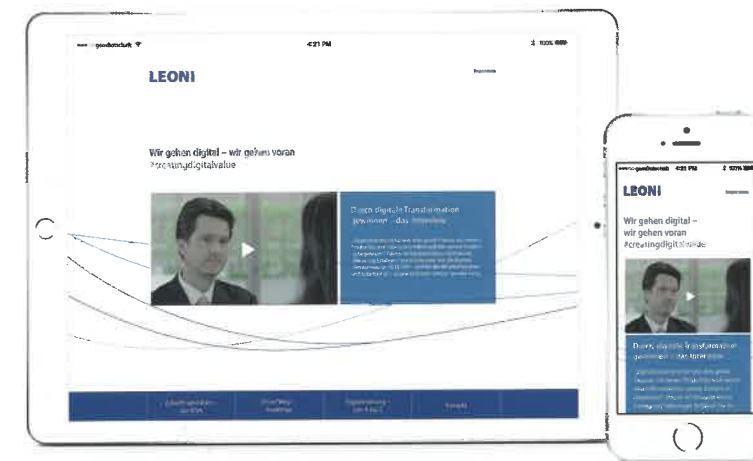
Pünktlich zum hundertsten Firmengeburtstag der Leoni AG startet die Kampagne zur digitalen Transformation des Unternehmens – entwickelt wurde die Change-Kommunikation von der Agentur gernBotschaft